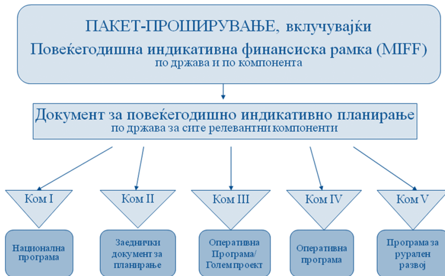
Слика 1 – Состав на пакетот на проширувањето

Најважниот документ, откако ќе се распределат вкупните средства по држави и по компоненти (MIFF), е MIPD, бидејќи во него се одредуваат секторите коишто ќе бидат финансирани во дадената временска рамка. Овој документ опфаќа тригодишен период и ги определува политичките приоритети за финансирање. Тој претставува „Библија“ за програмирањето и трошењето на средствата од ИПА. Даден проект не може да се финансира доколку не е споменат во MIPD. На пример, ако во MIPD не се споменати малите и средните претпријатија, тогаш ниту ЕК ниту Владата