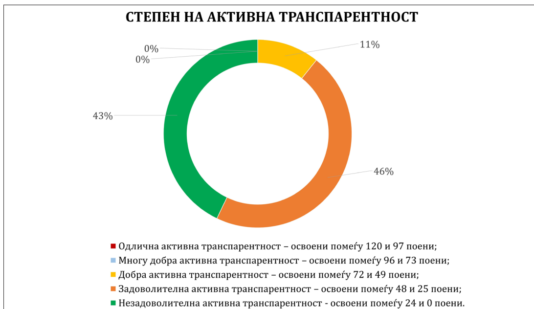
Графички приказ бр. 1:

Степен на активна транспарентност на политичките партии