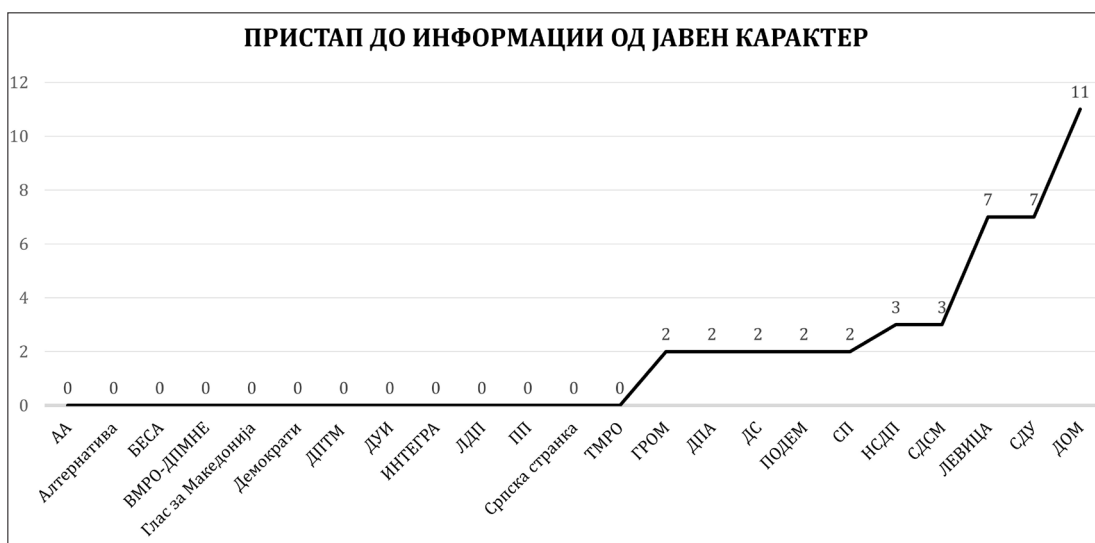
Графички приказ бр. 4:

Левица, ДС и ДОМ имаат објавено листа на информации од јавен карактер , а, единствено, кај ДОМ, листата е дополнета со линкови кои го поврзуваат податокот со соодветниот документ. Така, иако листата на ДОМ не е целосна, на листата за информации од јавен карактер има линкови кои водат до 8 од 21 излистана информација, меѓу кои: статут на партијата, контакт, органограм, годишен финансиски извештај, образците за слободен пристап, законите релевантни за политичките партии, годишниот извештај за спроведување на Законот за слободен пристап до информации од јавен карактер, како и контакт од лицето одговорно за слободен пристап до информации од јавен карактер.