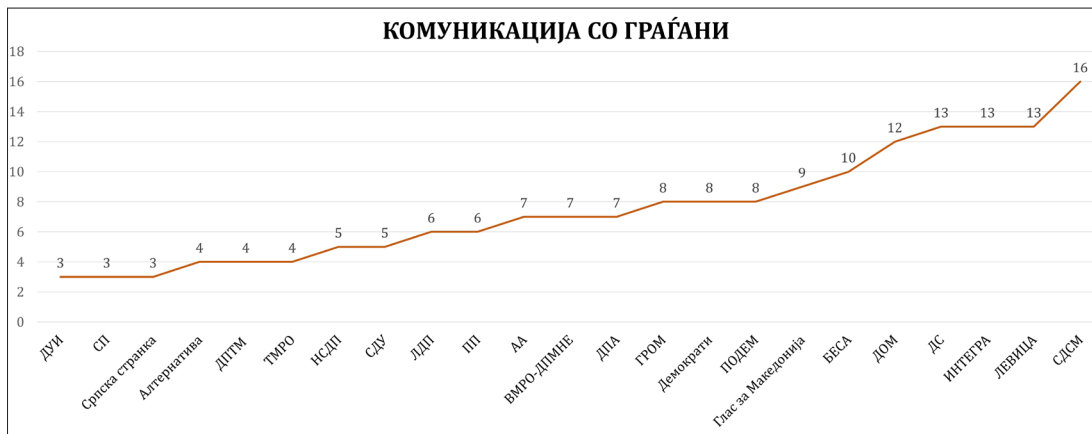
Графички приказ бр. 6:

Индивидуални резултати во категорија „комуникација со граѓани“