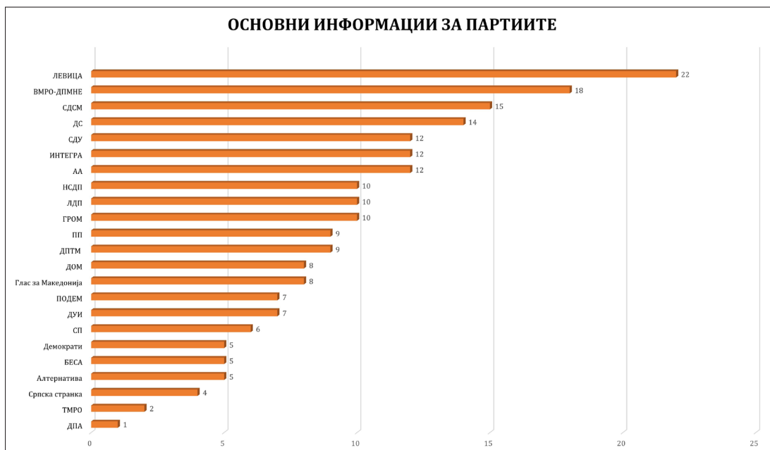
Графички приказ бр. 3:

Индивидуални резултати во категоријата „основни информации“