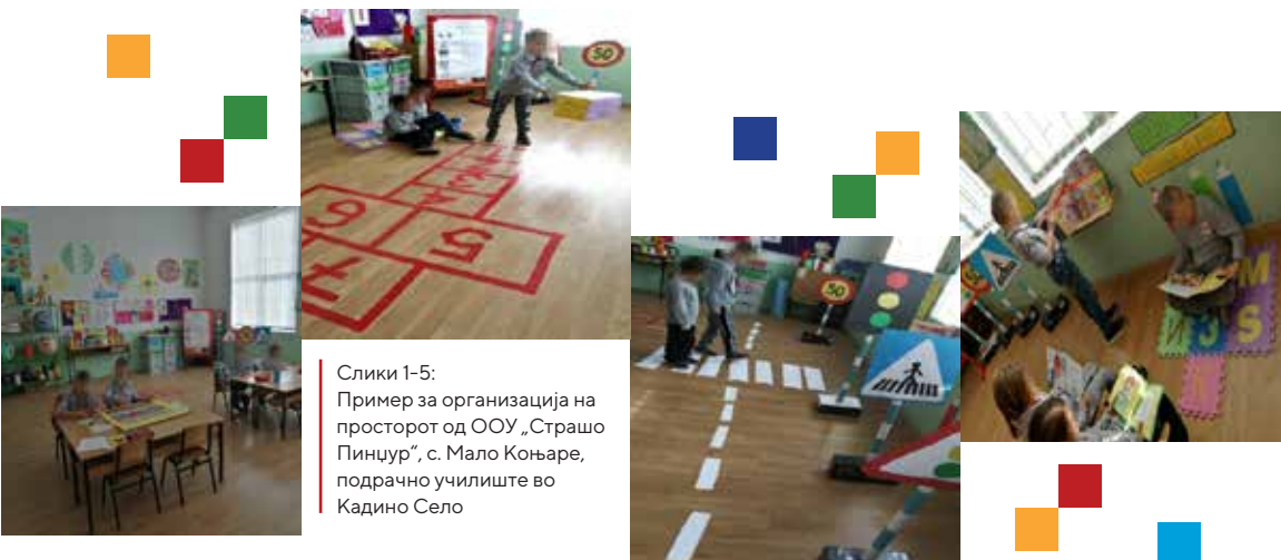
Слики 1-5: Пример за организација на просторот од ООУ „Страшо Пинџур“, с. Мало Коњаре, подрачно училиште во Кадино Село