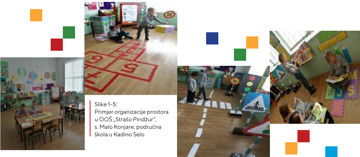
Slike 1-5: Primjer organizacije prostora u OOŠ „Stražo Pindžur“, s. Malo Konjare, područna škola u Kadino Selo